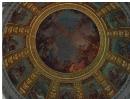
La fresque sous la coupole