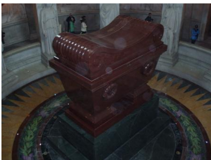
Le tombeau de Napoléon Ier

Sous le Dôme, Napoléon Ier repose en compagnie de ses deux frères, Joseph et Jérôme ainsi que de son fils l'Aiglon. Le transfert du corps de l'Empereur sera décidé en 1840, les funérailles nationales seront célébrées le 15 décembre de la même année. L'édification du tombeau, commandée au sculpteur Visconti, prendra fin en 1861, date à laquelle y seront inhumés les restes de l'Empereur. Façonné dans des blocs de porphyre rouge, placé sur un socle en granit vert des Vosges, il est cerné d'une couronne de laurier et d'inscriptions rappelant les grandes victoires de l'Empire.